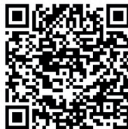
Designación de los Reyes Magos