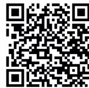
Concurso de belenes