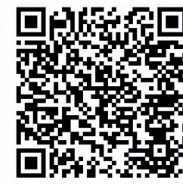
Concurso decoración de establecimientos comerciales