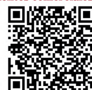
Concurso decoración de fachadas y balcones