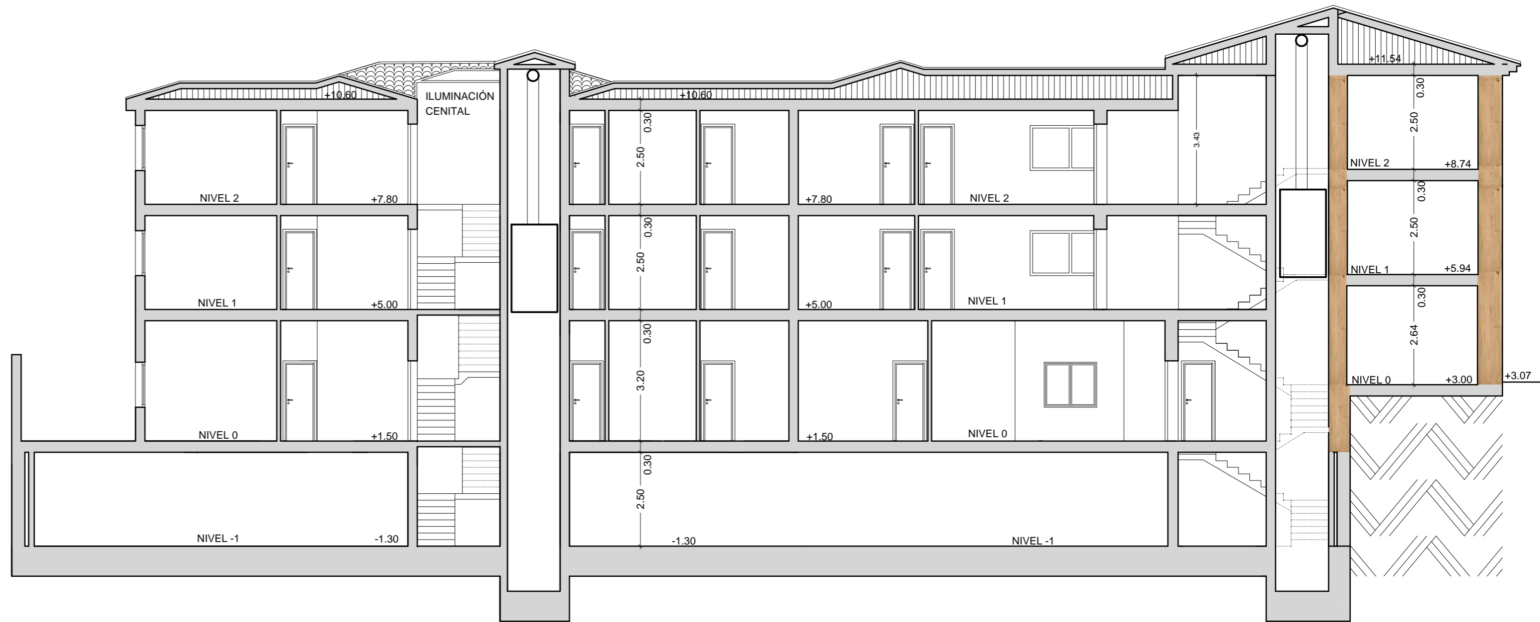
SECCIÓN - A